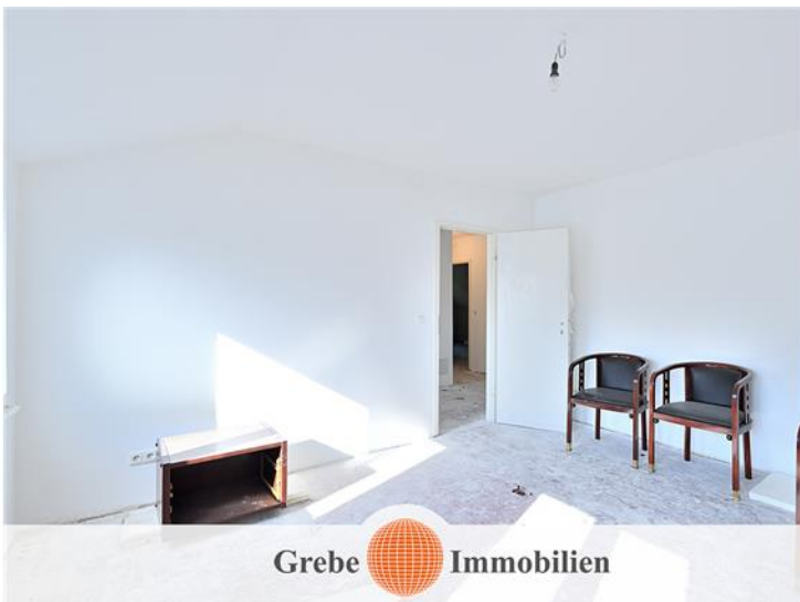
Zimmer 2 im DG Bild 2